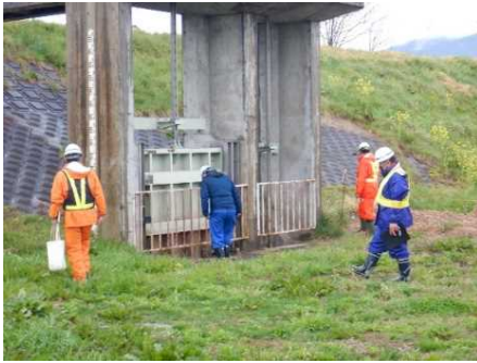
令和5年度の点検状況 （喜多方市日橋川緑地公園）