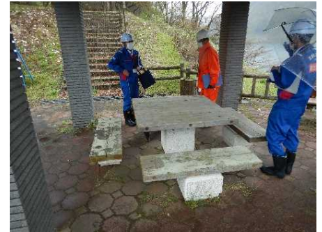
令和5年度の点検状況 （大川ダム管内若郷湖東公園）