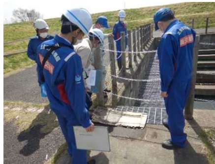
令和5年度の点検状況 （会津若松市木炭庵広場）