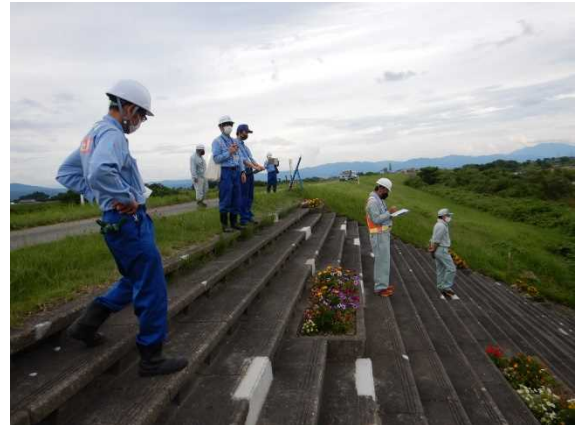
令和4年度の点検状況 （喜多方市塩川町会知地先）

・現地取材を希望される場合は、下記の間合せ先に点検日前日の17時までにご連絡下さい。