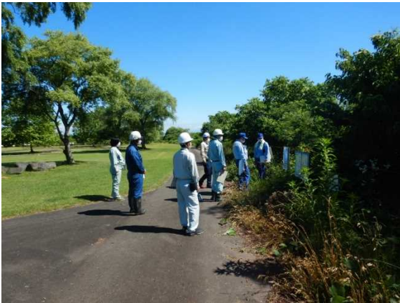
令和4年度の点検状況 （会津美里町都市公園せせらぎ緑地）

点検工程： 北会津出張所管内（別紙2 ①～⑪） 塩川出張所管内（別紙2 ⑫～⑯）