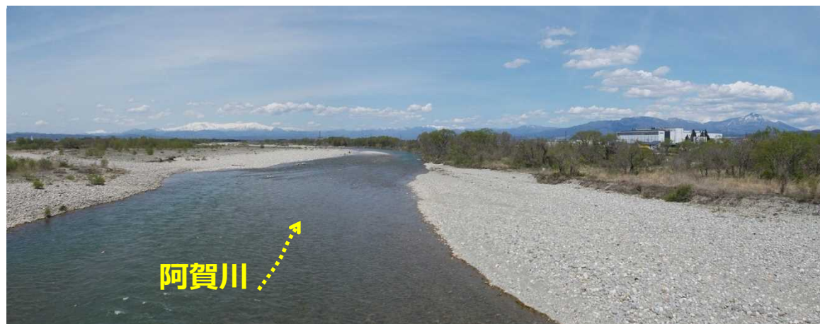
高田橋より見た阿賀川下流の様子 令和元年東日本台風以前の 平成31年4月29日撮影