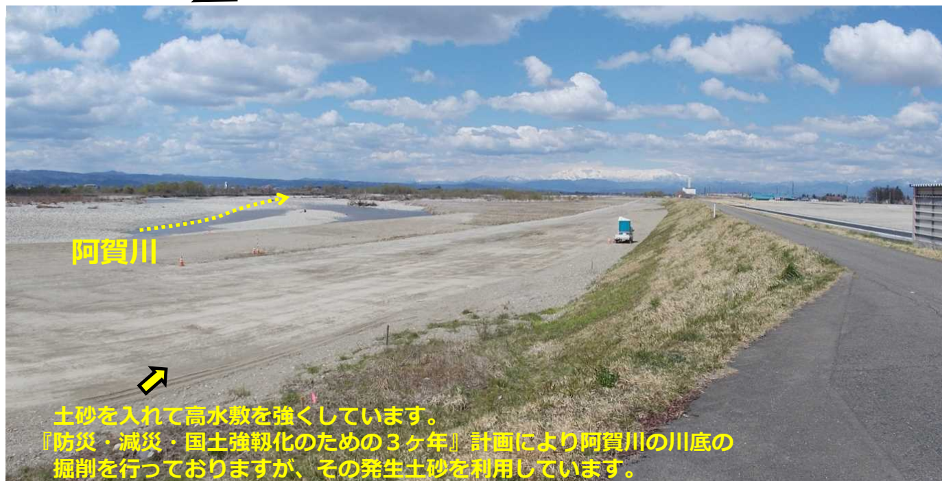
工事の状況 令和2年4月11日撮影

土砂を入れて高水敷を強くしています。 『防災・減災・国土強靱化のための3ヶ年』計画により阿賀川の川底の掘削を行っておりますが、その発生土砂を利用しています。