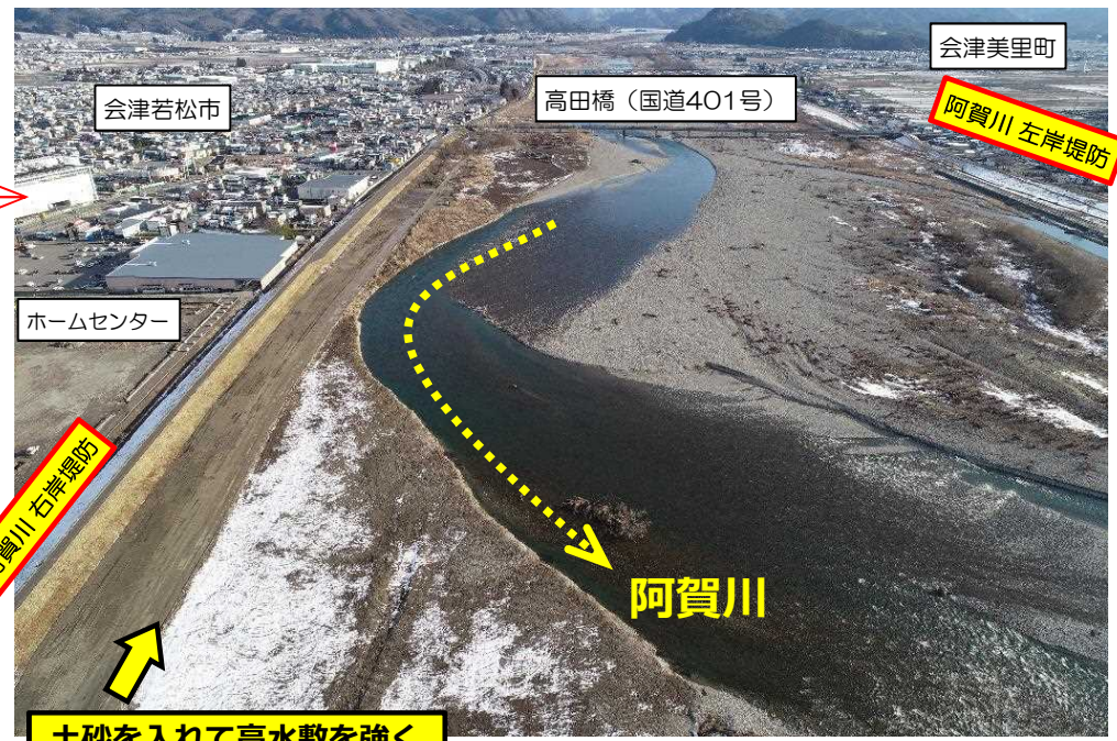
令和2年2月19日撮影 会津若松市神指町南四合より南を望む