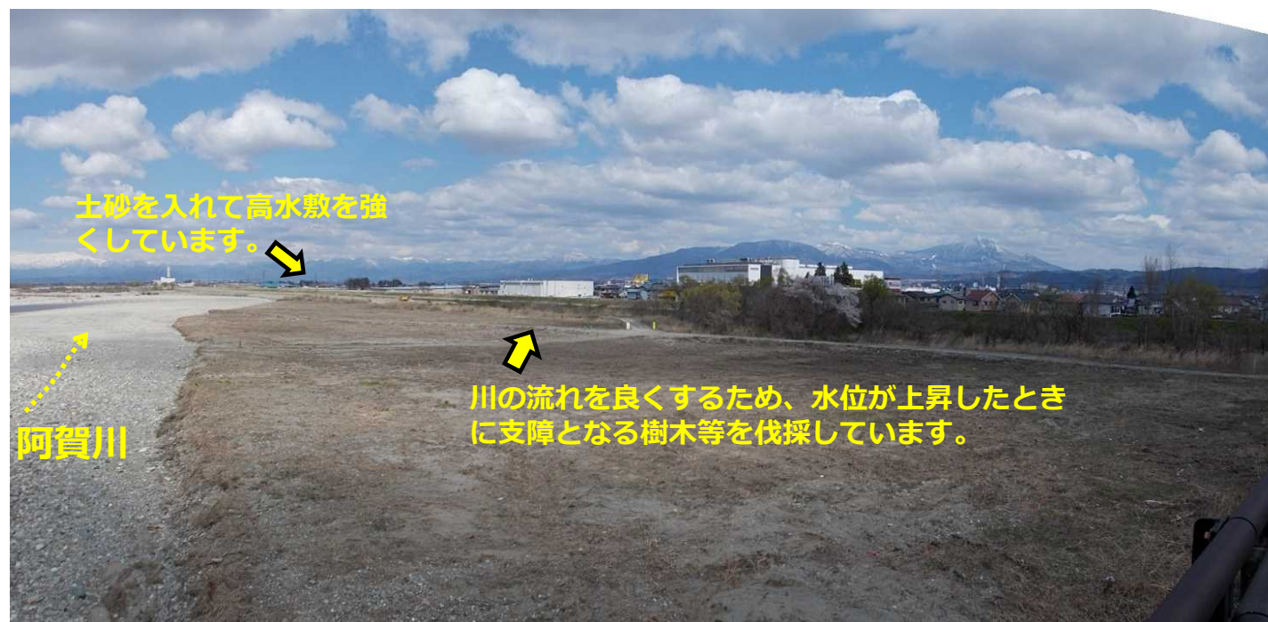
高田橋より見た 阿賀川下流の現在の状況 令和2年4月11日撮影