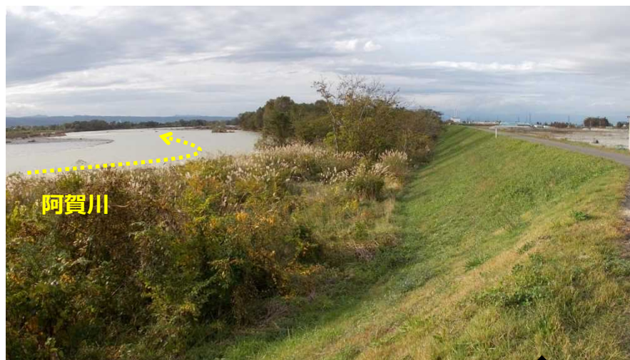
令和元年東日本台風直後の 令和元年10月27日撮影