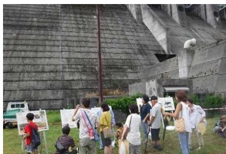
ダムを真下から見上げて見学