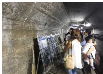
普段は公開していない「マット部」を見学