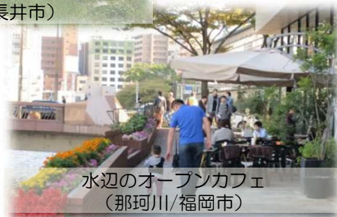
水辺のオープンカフェ (那珂川/福岡市)