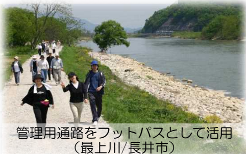
管理用通路をフットパスとして活用 (最上川/長井市)