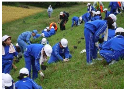
昨年の苗移植の様子