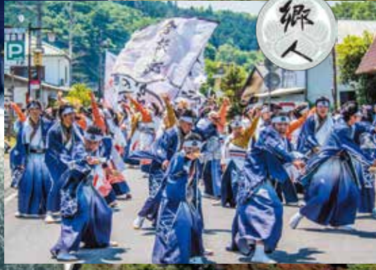
平成30年に大川ダムは30歳になります！