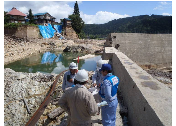
只見川 本名ダム下流(左岸)