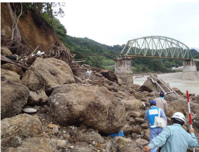
只見川 本名ダム下流JR橋(右岸)