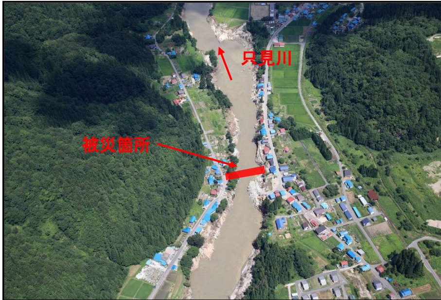
航空写真 国道252号二本木橋周辺の状況

国道252号二本木橋 鋼アーチ橋+RC連続 ラーメン 昭和29年架設 L=79.8m (うち被災L=66.8m)