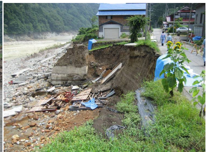
只見川 上田ダム下流(右岸)