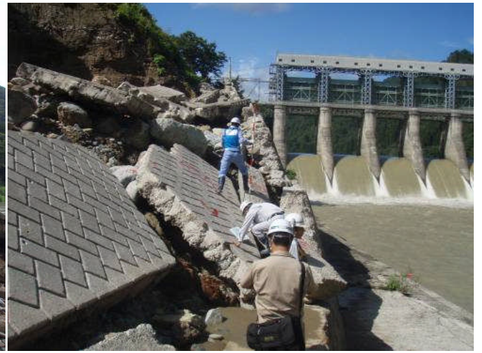
只見川 上田ダム下流(右岸)