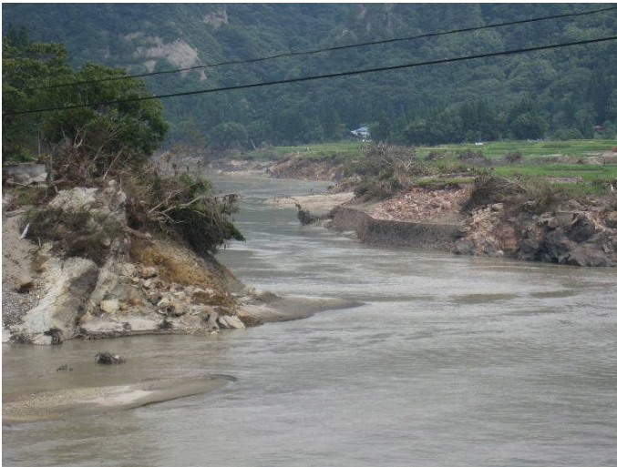
只見川 西部橋下流