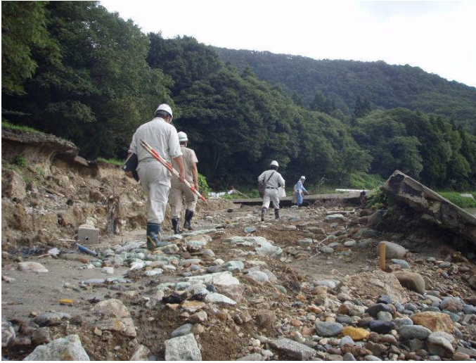
阿賀川 山郷ダム上流(右岸)