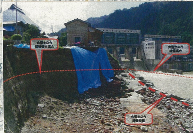
只見川②⑥ 上田ダム下流 応急工事箇所