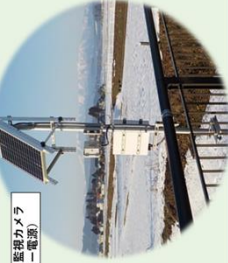
簡易型河川監視カメラ (ソーラー電源)