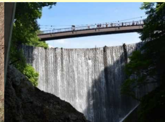
仮排水トンネル出口からの眺望