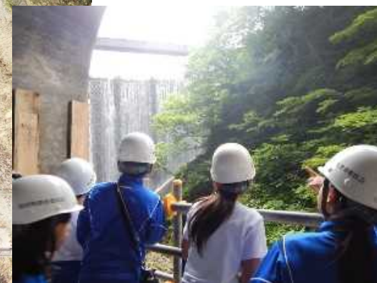
工事期間中の見学会の様子