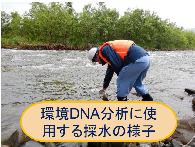
環境DNA分析に使用 する採水の様子