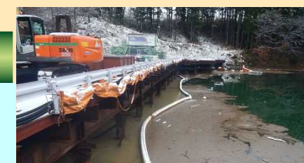
汚濁防止フェンス設置状況