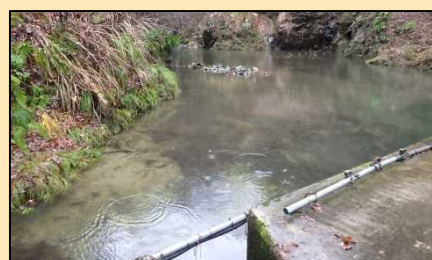
濁水防止フィルター撤去完了