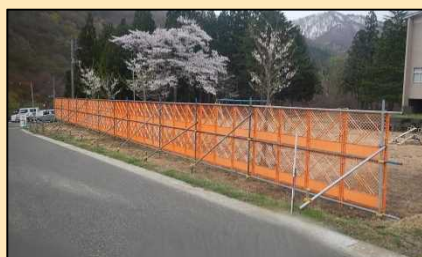
旭原公園フェンス撤去前

旭原公園と工所用道路の境界フェンスは、積雪によるフェンス倒壊の恐れがあるため、撤去しております。