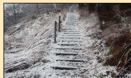
遊歩道手摺撤去完了