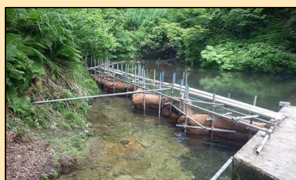
濁水防止フィルター撤去前

谷後地区取水堰の濁水対策として設置していた「濁水防止フィルター」は、冬期間の維持・管理が困難であるため、撤去しております。