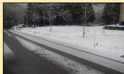
旭原公園フェンス撤去完了