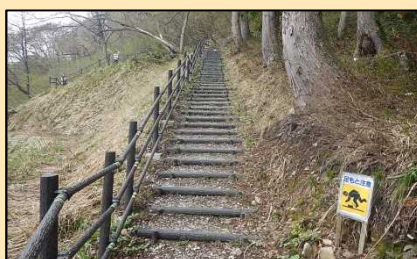
遊歩道手摺撤去前

大源太湖を周遊する遊歩道に使用している手摺は、積雪による倒壊の恐れがあるため、撤去しております。