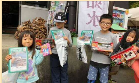
写真-学習帳を手にした子供達