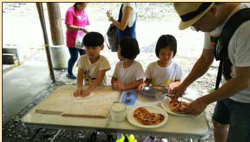
写真-ピザ焼き体験中