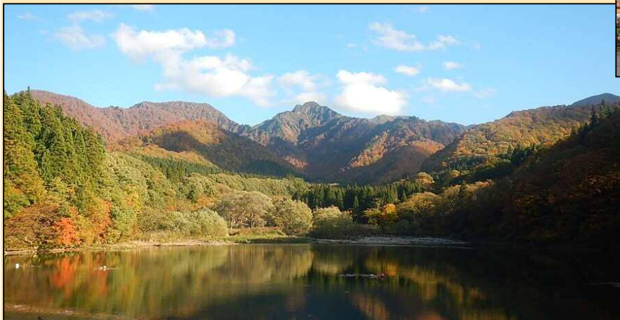
大源太湖に映る紅葉も美しい