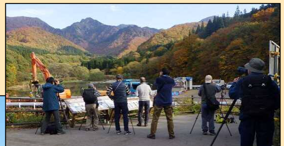
カメラを手に大源太山をパシャリ