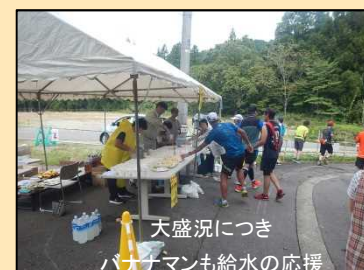
天盛況につきバナナマンも給水の応援