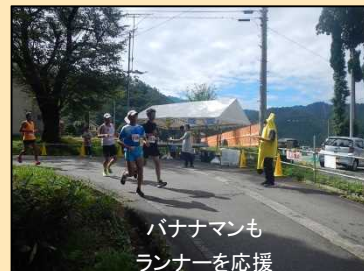
バナナマンもランナーを応援