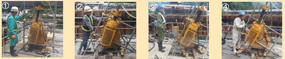
写真-確認ボーリングの施工中