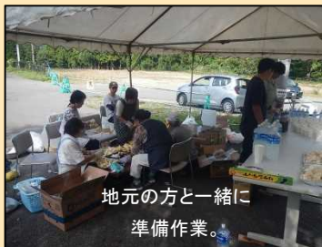
地元の方と一緒に準備作業。