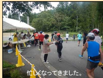
忙しくなってきました。