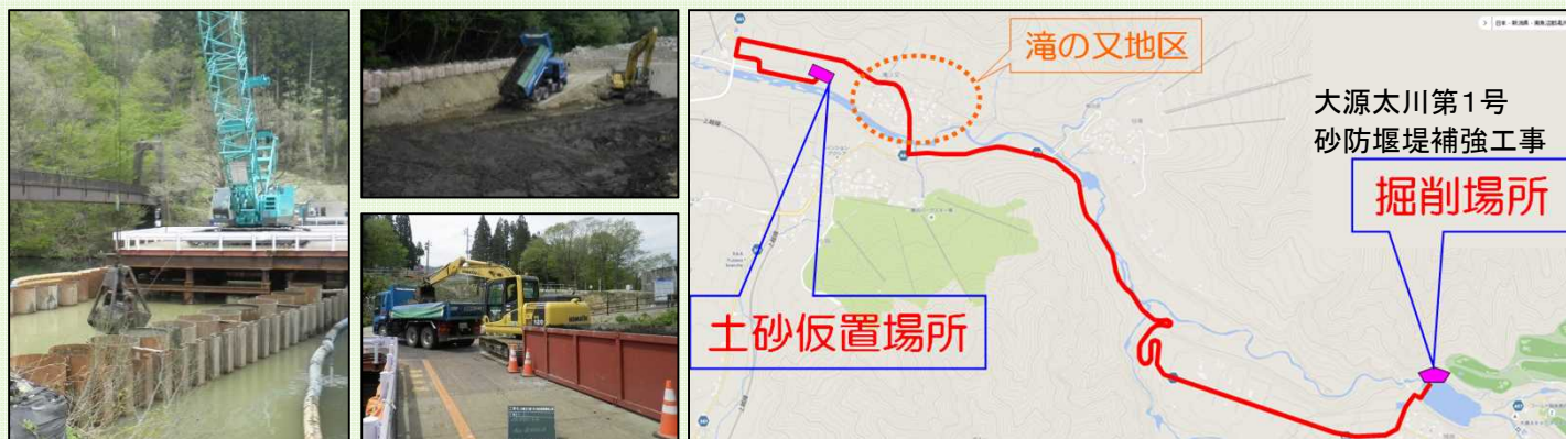
今年度の掘削、積込、土砂仮置状況

締切工の湖底堆積土掘削に伴い発生する土砂を、大源太川下流右岸部の仮置場へ搬出します。ダンプトラック運搬ルートはH28年11月と同様に、県道457号から滝ノ又地区を抜けるルートで計画しています。運搬時期は11月下旬から12月中旬（うち13日程度）を予定しています。近隣の皆様にご迷惑とならないよう、環境対策等十分配慮し進めてまいりますので、ご理解の程、よろしくお願い致します。滝ノ又地区の皆さんへは、詳細決まりましたらお知らせします。