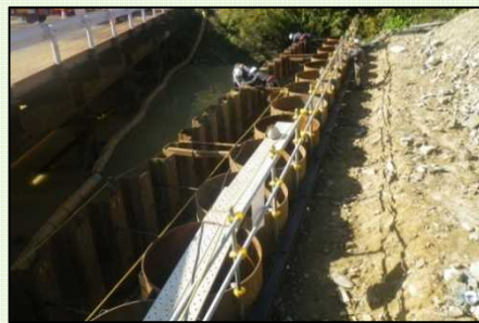
タイロッド施工状況