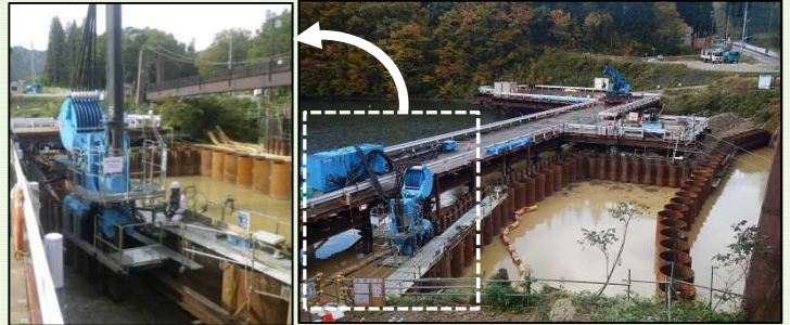
止水鋼矢板施工状況

左岸側は、鋼矢板の頭部を、タイロッドという鋼材で固定した後、10月末に盛土を行いました。