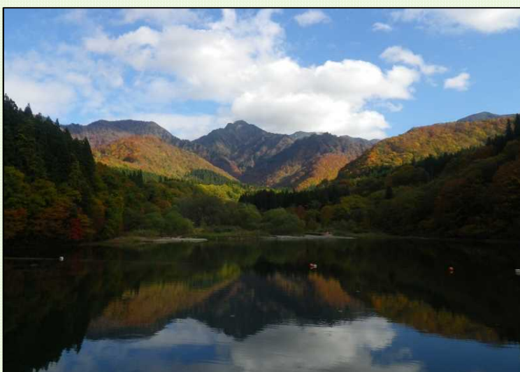
大源太湖に映る紅葉も美しい