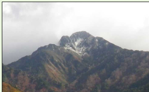
初冠雪した大源太山