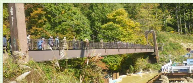
観光客で賑わう希望大橋