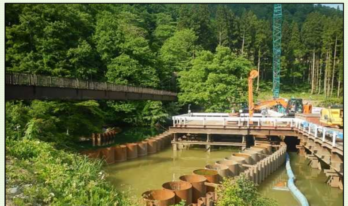
湖底堆積土砂撤去状況(左岸側より)