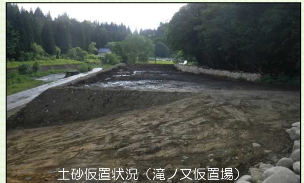
土砂仮置状況（滝ノ又仮置場）

今後、2期施工時において運搬場所、方法が決まりましたら改めてご案内したいと思います。今後ともご協力のほど、よろしくお願い致します。