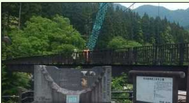
堰堤や工事の様子をご覧になる参加者

湯沢砂防事務所のホームページから大源太川第1号砂防堰堤補強工事の最新情報をご覧頂けます。アドレスは「 http://www.hrr.mlit.go.jp/yuzawa/ 」です。