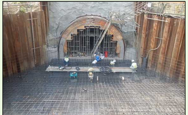
トンネルアーチ部の覆工型枠と呑口部の鉄筋

仮締切内の湖底堆積層の掘削・運搬・仮置きを5月30日で完了しました。引続き、仮締切内をトンネル掘削土砂にて埋め戻す作業を行っています。