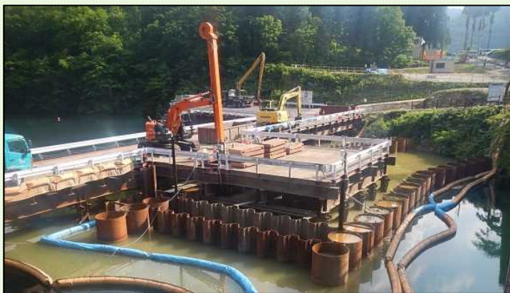
湖底堆積土砂撤去状況(希望大橋より)