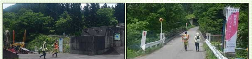
個人のペースで参加するユニバーサルウォーク