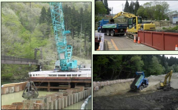
掘削、積込、土砂仮置状況

締切工の湖底堆積土砂掘削に伴い発生する土砂を、滝ノ又橋上流右岸部の仮置場へ搬出しています。ダンプトラック運搬ルートは県道457号を経て滝ノ又橋右岸橋詰から土砂仮置場に運搬しています。近隣の皆様にご迷惑とならないよう、環境対策等十分配慮して工事を進めてまいりますので、ご理解の程、よろしくお願い致します。