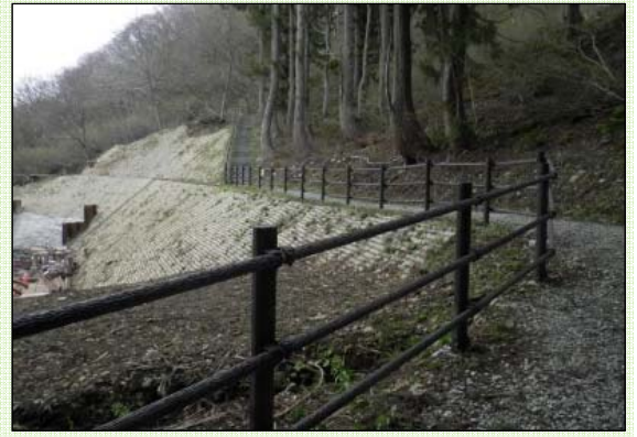
復旧が完了した遊歩道