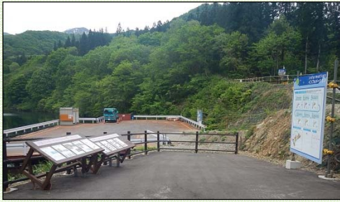
インフォメーションコーナー