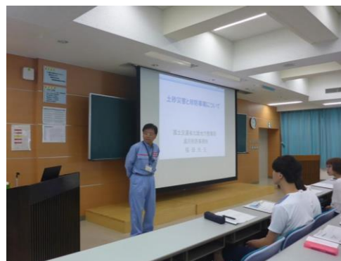
ご清聴ありがとうございました