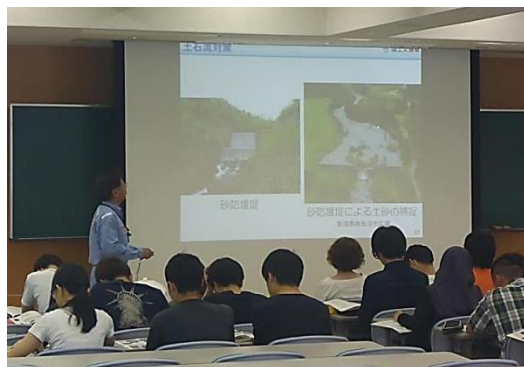
土砂災害について説明

講義終了後は、個人的に質問に来てくれる学生もいて、土砂災害や砂防事業について興味を持ってくれたのではないかと思います。