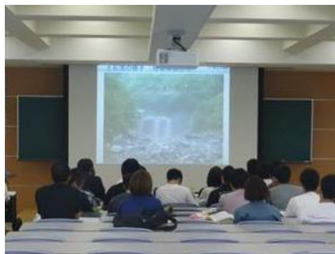
土砂崩れの映像を紹介