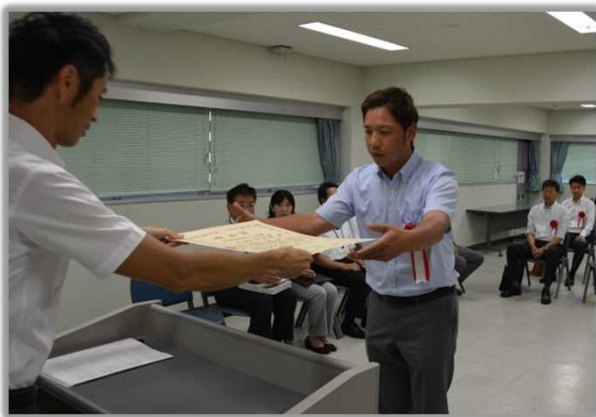
森下事務所長から表彰状を授与

優良工事等の表彰は、平成27年度に完成した工事及び委託業務の中から、その施工及び成果が特に優秀で他の模範となる工事等を表彰するものです。(受賞者は別紙のとおり)