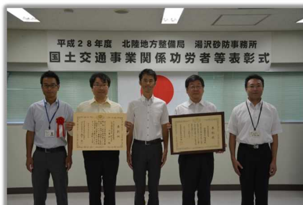
応用地質(株)新潟支店