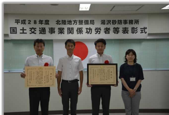
(株)ナルサワコンサルタント長岡支店