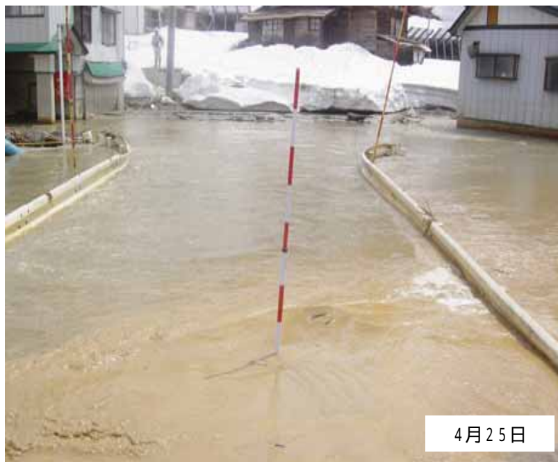
< 榑木橋付近 河道掘削前 >