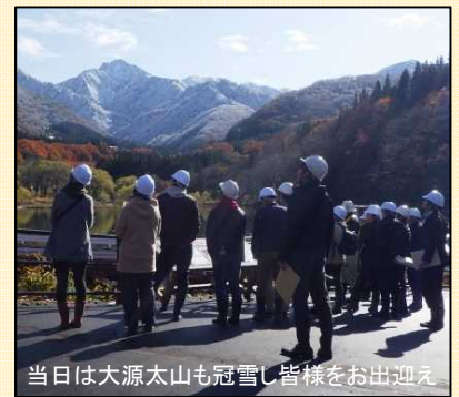
当日は大源太山も冠雪し皆様をお迎え

多くの観光客が訪れる場所での工事なので、観光ルートの確保や振動、騒音対策、環境対策がとても重要です。今後も関係者と連絡を取り合い、観光客への配慮や対策をしっかりと行っていきたいと思ひます。