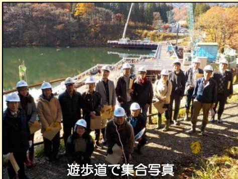
遊歩道で集合写真

11月17日、湯沢町観光協会による工事現場視察会が行われました。当日は観光関係者16名の方が参加され、貫通した仮排水トンネル内の施工状況、仮締切工の鋼管杭施工状況等を見て頂きました。特殊な施工機械やトンネル内の様子など、皆さん大変熱心に興味深く見学をされていました。