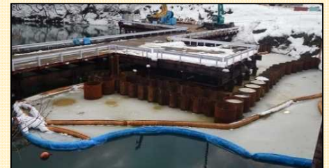
汚濁防止フェンス