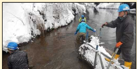
谷後取水堰堤撤去状況

湖水の濁りを防止するため設置していた汚濁防止フェンスについても、フェンス内の濁りがなくなるのを待ち一旦撤去する予定です。