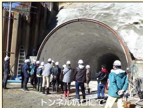
トンネル坑口にて