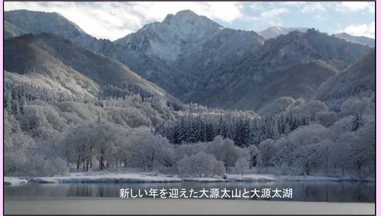
新しい年を迎えた大源太山と大源太湖