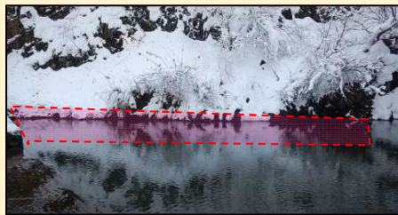
谷後取水堰堤撤去完了