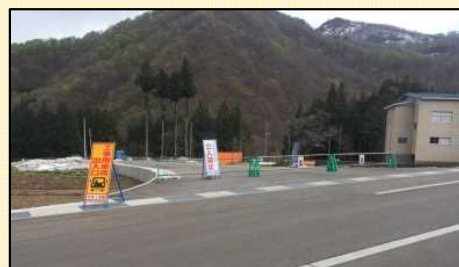
県道と工事用道路の境界はバリケードにて進入防止を行っています。