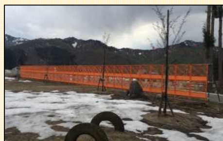
旭原の公園と工事用道路の境にフェンスを復旧しました。