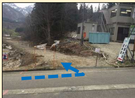
周遊路利用者に向けて周遊ルートを説明する案内看板を設置しています。