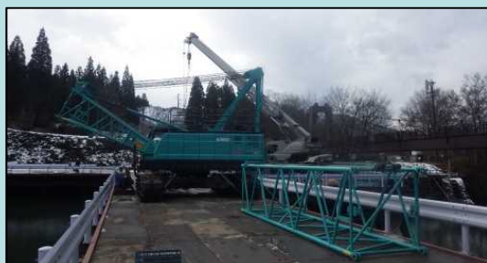
解体中のクローラクレーン

栈橋工事で使用したクローラクレーンの解体を12月9日に行い、栈橋上の資機材を全て撤去いたしました。