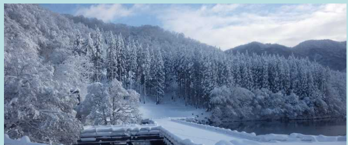
冠雪した現場と大源太湖

湯沢砂防事務所のホームページから大源太川第1号砂防堰堤補強工事の最新情報をご覧頂けます。アドレスは「 http://www.hrr.mlit.go.jp/yuzawa/ 」です。