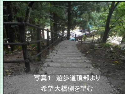
写真1 遊歩道頂部より 希望大橋側を望む