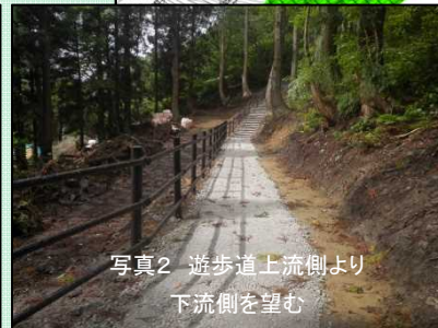
写真2 遊歩道上流側より 下流側を望む