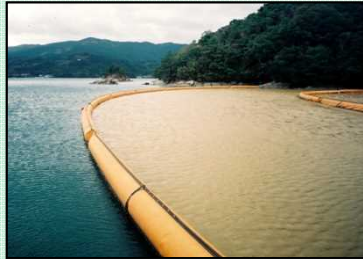
汚濁防止膜のイメージ