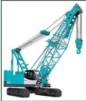
使用する大型クレーン

作業は4月5日から大型クレーンを搬入し、仮栈橋（緑色）を施工します。今月は青で囲んだ部分を施工する予定です。杭の打設箇所については汚濁防止膜で囲い、湖水の濁りの抑制に努めます。