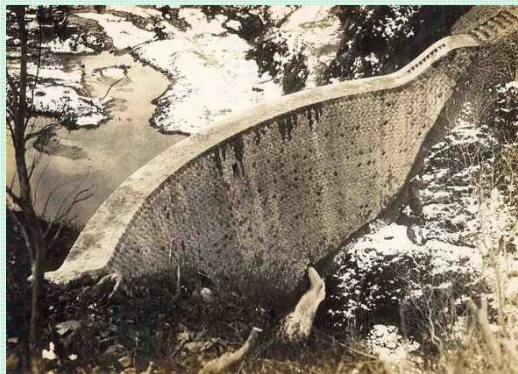
完成時の大源太川第1号砂防堰堤(昭和14年11月頃)

大源太川第1号砂防堰堤は、昭和14年竣工の登録有形文化財及び土木遺産に登録されたアーチ式砂防堰堤です。