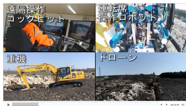
図-7 第2回試験での除雪車の走行・操作イメージ

第2回遠隔操作試験において、コックピット型コントローラの操作が操作ロボットに連動して除雪車が走行するイメージを図-7に示す。試験期間を通して溝を1日1本ずつ切削し、切削長が最長となった日は65mを記録したほか、試験期間の最終日には溝と溝を連結させた。また、雪山の崖の手前まで寄ることも成功した。溝を切削した後の状況を図-8に示す。試験を通しての意見として、操作卓では、除雪車の動きと連動してコックピットの座席が傾くとよいという意見があった。カメラの設置箇所と視野では、視点付近と足元の視野が繋がっていたほうが、また、左右のカメラが下を向いていたほうが作業しやすいという意見があったため、手動にて調整した。通信環境については、雪山の高くなった箇所に近づくと通信環境が不良となるほか、除雪車の「人検知システム」をONにしていると雪山の影を人と