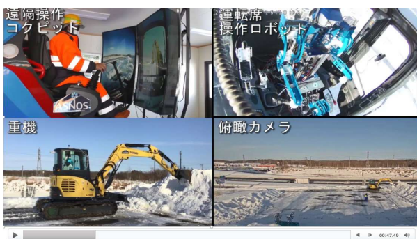
図-4 第1回試験での除雪車の走行・操作イメージ

走行する際には、ハンドルの遊びがないので左右のブレを直そうとすると反対側に行き過ぎてしまうことや、曲がるときに角の場所がわかりづらいため行き過ぎるか手前になりすぎるといった意見があった。また、排土板で雪を押し出すときやバケットで雪をすくうときの圧