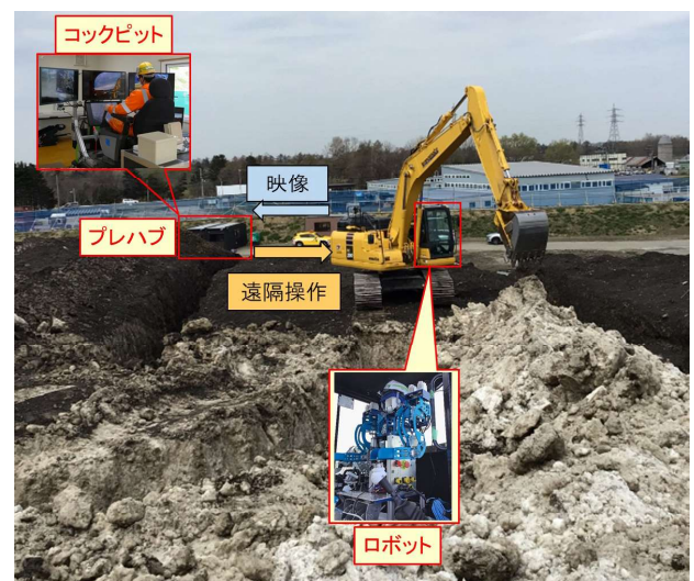
図-5 第2回遠隔操作試験状況

除雪車に設置するカメラは、第1回試験での意見をを受けて正面と左右のほかにも足元にも設置できるようにしたほか、角度を作業員自身で調整可能とした。また、周囲を俯瞰撮影するカメラはスマートフォンを用い、作