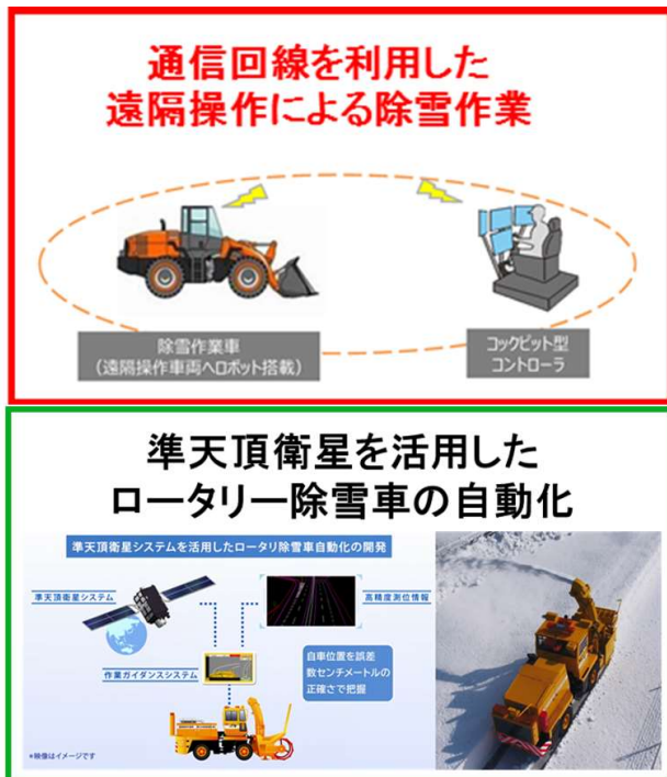
図-1 北海道の高速道路での 雪氷対策高度化の取組み事例

東日本高速道路（株）北海道支社では、将来の労働者不足等に備えた雪氷対策作業の効率化や省力化を目指し、通信回線を利用した遠隔操作による除雪作業に関する研究と開発を行っている(図-1)。この研究開発の中で、すでに実用化されている建設重機を対象とした遠隔操作技術を除雪作業へ適用するために、令和3年に2回の性能確認試験を行った。第1回試験は2月に実施し、高速道路の休憩施設に併設されたヘリポートにおいて基本的な走行と操作を試験した。第2回試験は4月に実施し、第1回試験の結果を踏まえて、雪捨場の敷地内で実作業に近い試験を実施した。本論文では遠隔操作のしくみや試験の概要と結果および課題や被験者からの意見等について説明する。