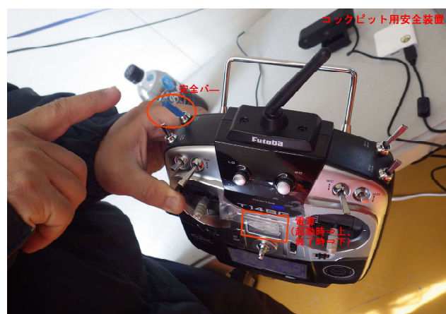
図-9 遠隔操作装置の使用方法説明例

2回の遠隔操作試験を通して、コックピットの動きやカメラの角度や昼夜等の環境による視認性の良否および通信環境などの課題を抽出することができた。特に第2回試験では実際の除雪作業に近い作業ができたほか、遠隔操作に関する装置の起動と終了の一連の作業を説明しておくことで、開発者がいなくても作業を行うことができ、遠隔操作作業を運用させるための道筋