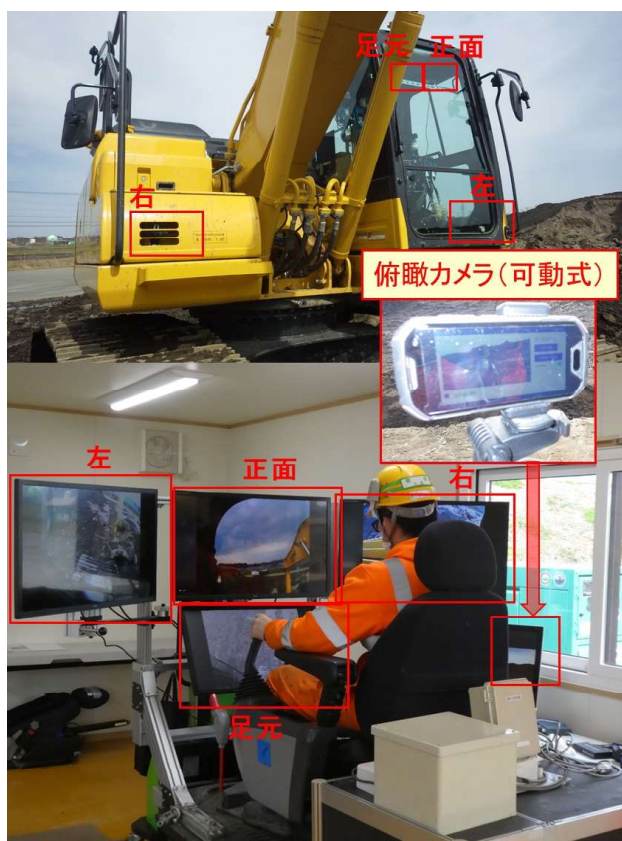
図-6 除雪車に設置したカメラ（上）の配置箇所と コックピット（下）への映像伝送イメージ

業箇所に合わせて持ち運んで設置できるようにした。カメラの配置箇所とコックピットへの映像伝送イメージを図-6に示す。なお、通信環境はすべて4Gにて行うこととした。