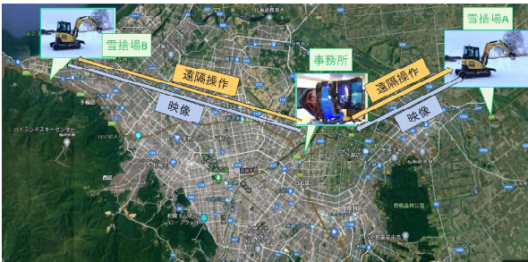
図-10 今後の開発イメージ

東日本高速道路（株）北海道支社では、継続開発として普段待機している事務所から現場に行く時間を省くべく、事務所から雪捨場での遠隔操作を目指した開発や1基のコックピットから複数の雪捨場での遠隔操作を目指した開発を進めるとともに、実運用に合わせた遠距離（20km程度）での遠隔操作試験に向けて準備を進めている（図-10）。また、より実践的な作業をすることを目指してこれまで作業してきたバックホウや油圧ショベルのほか、機種を変えて雪を運んでいく作業を行うべく準備を進めている。今後も雪氷対策作業の効率化や省力化を目指して今後の機器開発や実運用に向けた調整を進めていきたい。