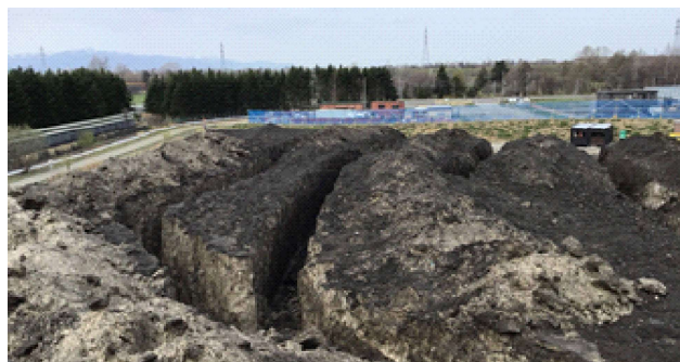
図-8 溝の切削後の状況