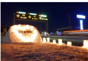
写真-5 ハート型の設置

函館新道では、夏から秋にかけて植栽活動が行われており、これと同じ場所に設置された手作りのアイスキャンドルには、その花が使用されている。（写真-7,8）