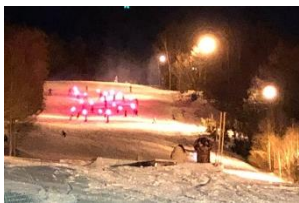
写真-28 たいまつ滑降