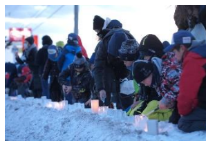
写真-6 小学生も多数参加