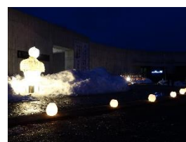
写真-15 土偶を模したランタン