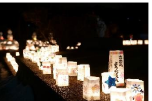
写真-22 幼稚園児の作品