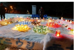
写真-23 色とりどりのランタン