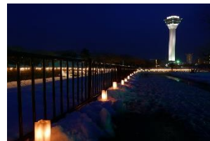
写真-9 外周の散策路

一年を通じて、国内外の観光客が多く訪れる五稜郭公園会場では、堀の外周が約 1.8km の散策路となっており、美しい星型がイルミネーションとともに浮かび上がる。公園の周遊路を散策しながら楽しむほか、五稜郭タワー展望台から見おろす景色は誰もが歓声をあげる。（写真-9,10,11,12）