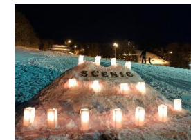
写真-27 コース上のキャンドル

七飯町のスノーパークでは、「雪育プロジェクト」との連動により、たいまつ滑降と合わせて実施した。たいまつ滑降参加者 20 名は、チームワーク良くゲレンデを幻想的に滑ることができ、スタッフと初開催のお客様が一体となる素敵なイベントとなった。(写真-27,28)