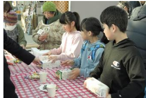
写真-2 牛乳パックを回転