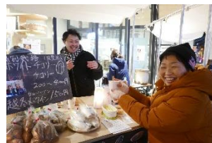
写真-18 シエスタハコダテ前