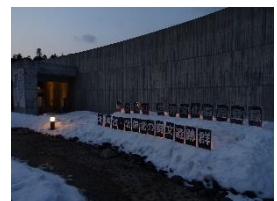
写真-14 世界遺産の PR