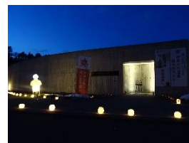
写真-13 道の駅の活用

2021(令和 3)年 7 月、「北海道・北東北の縄文遺跡群」の世界文化遺産への登録が決定した函館市縄文文化交流センター会場では、同センターの駐車場や沿道に飾られた約 400 個のワックスキャンドルの明かりが雪上を優しく照らし、来場者とドライバーの目を楽しませた。（写真-13,14,15,16）