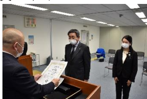
写真-31 表彰式の様子

た「第17回シーニックバイウェイ北海道推進協議会」において、函館・大沼・噴火湾ルートの「函館新道『花いっぱい活動』及び『シーニック de ナイト』」の一連の取組みが「ベスト・シーニックバイウェイズ・プロジェクト 2019」の最優秀賞、美しい景観づくり賞を受賞した。この受賞により、私たち地域活動団体の取組みが対外的にも評価されたことや今後の継続展開に向けて、大きなモチベーションとなる大変嬉しい出来事であった。(写真-31,32)