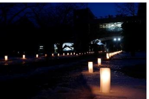
写真-21 道の駅からのアプローチ

道の駅「YOU・遊・もり」に隣接するオニウシ公園会場では、町民ボランティアの手づくりキャンドルによるライトアップフェスティバル「オニウシ雪ほたる」という関連イベントを実施した。道の駅では、森町の特産品の販売等、訪れた方々への各種サービスを展開した。(写真-21,22,23,24)