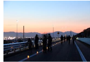
写真-29 本線上の散策

2021(令和3)年3月に開通した函館新外環状道路の開通記念プレイベントとして、「新外環を歩こう! ナイトウォーク in 函館新外環状道路」を3月12日に開催した。コロナ対策をしながら、函館の夜景とともに開通直前の道路本線上を歩く貴重な体験は、家族連れなど50組140名の一般参加者に大変好評だった。(写真-29,30)