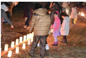
写真-17 亀田八幡宮境内

函館朝市会場では、各店舗前や広場にそれぞれキャンドルを設置し周遊促進を図った。(写真-20)