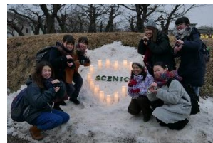
写真-11 大学生も参加