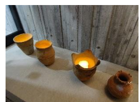
写真-16 土器型のキャンドル