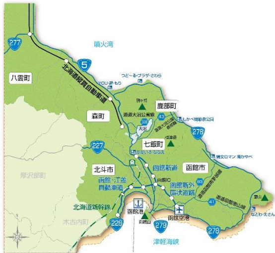
図-2 道南地域の位置図

私たちが暮らす「函館・大沼・噴火湾ルート」は、函館市・北斗市・七飯町・鹿部町・森町・八雲町から形成され、多彩な景観地域資源を有する地域にあり(図-2)、美しい景観の保全や地域住民と来訪者の交流を深める企画として、沿道等を舞台とした「シーニック清掃活動」、「シーニック de ナイト」等の様々なルート連携活動を展開している。