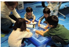
写真-3 キャンドルの冷却