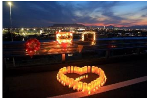
写真-30 夜景フォトスポット