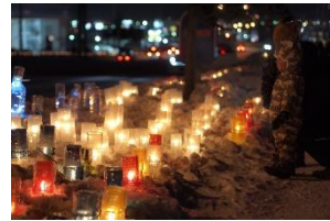
写真-7 国道沿道の演出