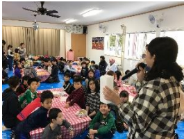
写真-1 キャンドル製作会

製作体験会では、各会場に設置するワックスキャンドルを実行委員会の構成団体メンバーや地元住民、観光客らが製作に携わる。具体的には、牛乳パックに溶かしたろうを流し込み、回転させながら冷やして固め、中が空洞になった角柱型キャンドルに仕上げていくという工程である。（写真-1,2,3,4）