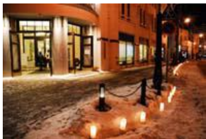
写真-19 まちづくりセンター