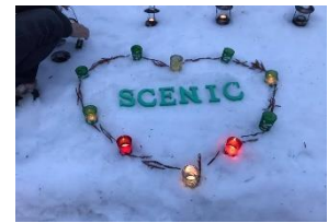
写真-26 参道入口の設え