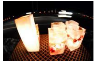
写真-8 押し花キャンドル