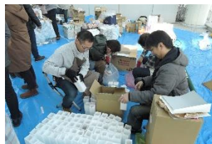
写真-4 キャンドルの加工