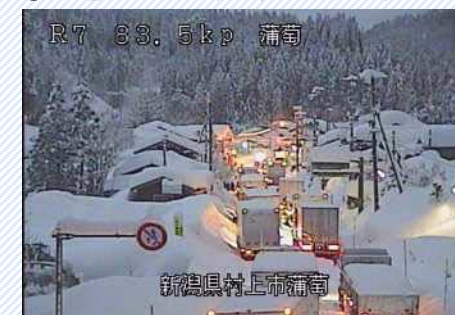
H30. 2. 6