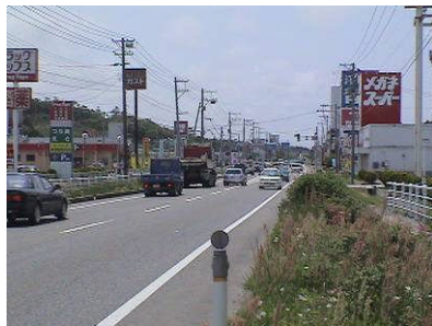
国道7号村上市街地の様子

商業施設が連続し、沿道店舗への出入りに起因する追突事故が多発している国道7号村上市街地において、交通事故の防止、渋滞緩和を目的とした総合的な交通対策を実施する事業です。