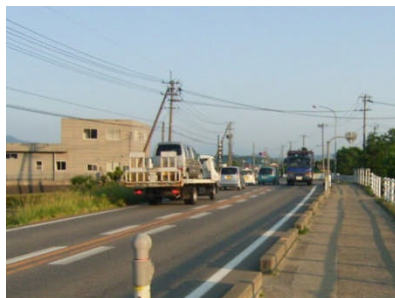
国道7号村上市小川地区の様子

当該箇所は、緩いカーブ区間で、右折レーンが設置されていない4箇所の交差点において、追突事故が多発している。本事業は、右折レーンの設置により、追突事故の防止を図る事業です。