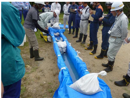
側溝での油回収実験