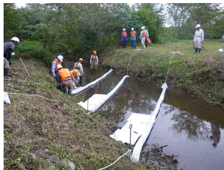
吸着マットの設置訓練