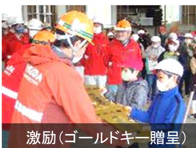
激励(ゴールドキー贈呈)