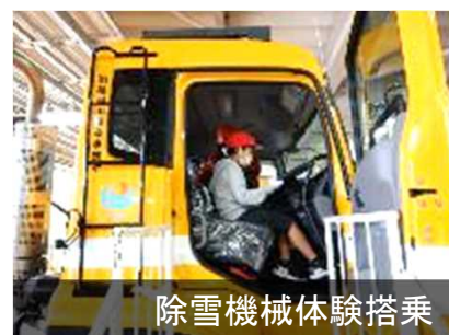
除雪機械体験搭乘