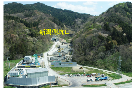
11号トンネル工事現場全景