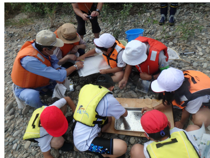
つかまえた生き物を分類