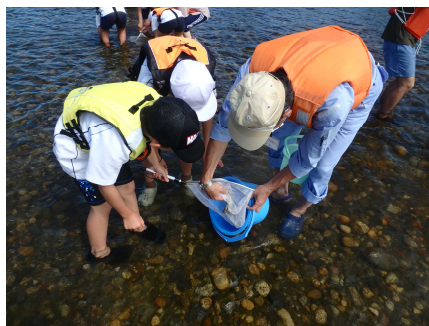
川にすむ生き物を採取