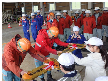
小学生からの鍵の引渡し