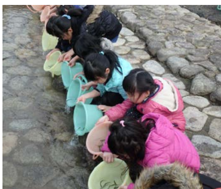
サケ放流の様子（平成30年3月）

場所： 村上市葛籠山地先 神林水辺の楽校（がっこう） 荒川右岸 国道7号「荒川橋」上流約1 km