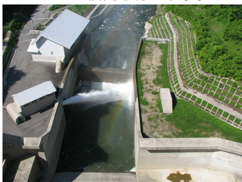
▲利水放流設備からの放流