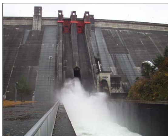
ダム放流時の様子