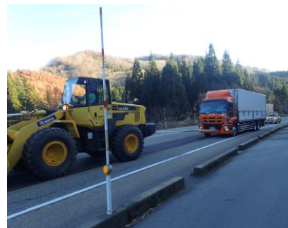
昨年度の「けん引訓練」