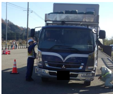
昨年度の「チェーン装着指導訓練」