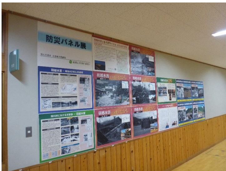
関川中学校内でパネル展を実施中