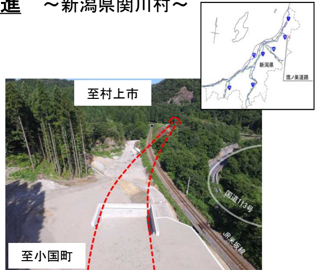
おおうちぶち 写真：大内測地区から起点側（村上市方面）を望む