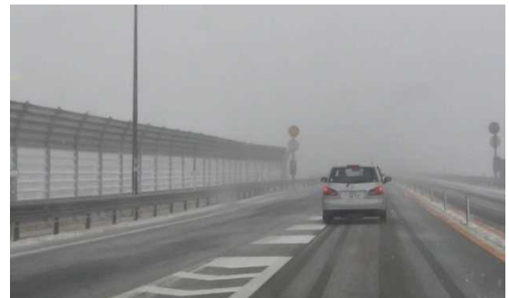
写真：地吹雪防止柵設置箇所（金屋地区）