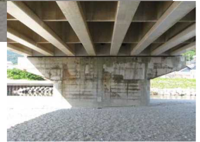
写真：府屋大橋P2橋脚