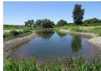
平成28年3月に完成した かみほやし 神林地区のたんぼの再生状況 （平成28年7月撮影）