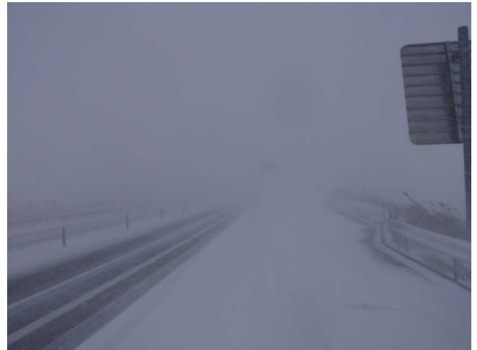
写真：地吹雪発生状況