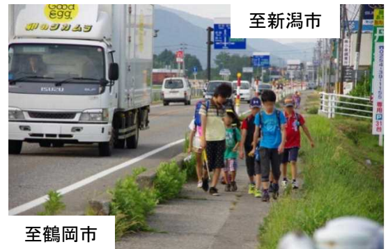
写真：坂町病院前交差点から起点側（新潟市方面）を望む