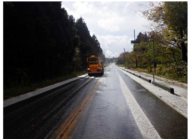
（国道7号村上市板屋越地先）