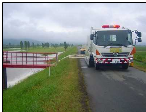
H23 出水出動状況(村上市鳥屋地先)