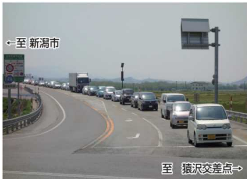
朝日まほろば I C での混雑状況 (H27.5.2 撮影)

※昨年の春の大型連休では、日本海東北自動車道及び並行する国道7号の経路所要時間の実測調査を行った結果、朝日まほろば I C 終点部において、9～11時台に混雑が見受けられました。