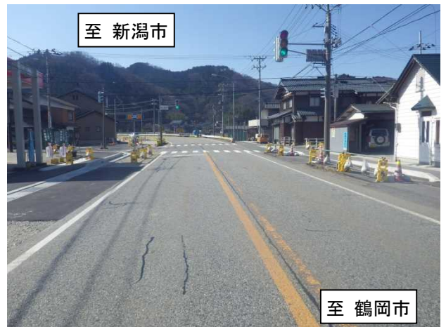
がつぎ 写真：勝木駅前交差点から起点側（新潟市方面）を望む