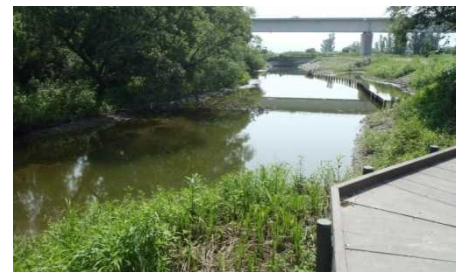
平成26年3月に完成した金屋地区のたんぼの再生状況 （平成26年7月撮影）