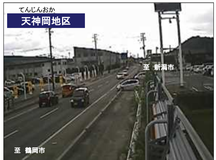
写真: 出入り車両の状況