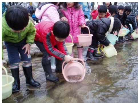
サケ放流の様子（平成26年3月）

場所： 村上市葛籠山地先 神林水辺の楽校（がっこう） 荒川右岸 国道7号「荒川橋」上流約1 km