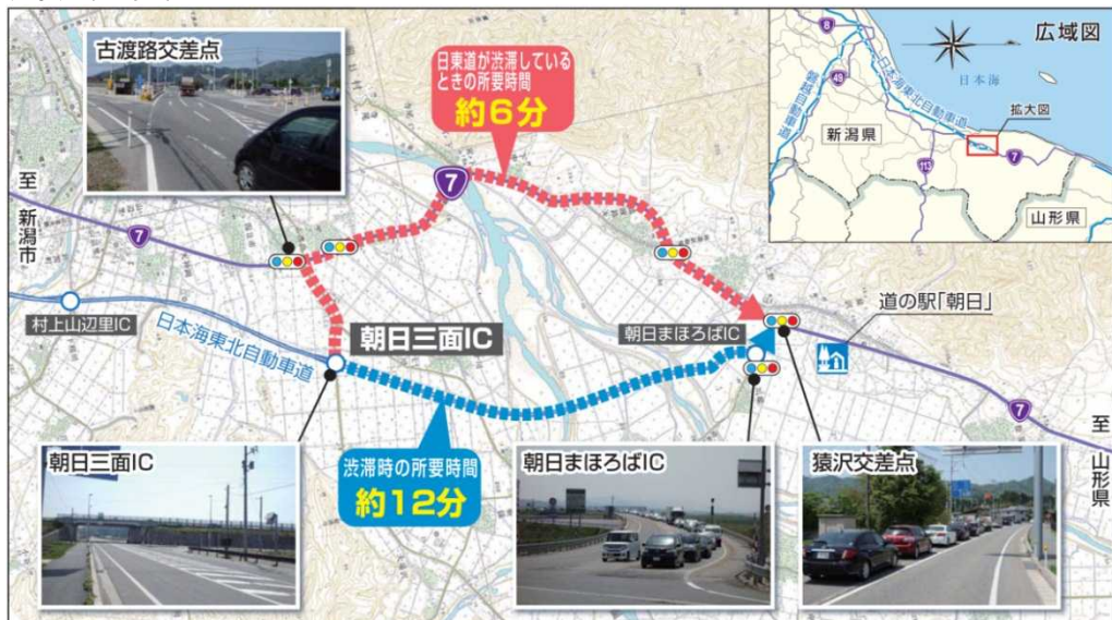
※地図に記載された所要時間は、今年GW(5/2)の実測値であり、目安とお考えください。

なお、今年のゴールデンウィークに、日本海東北自動車道と並行する国道7号の経路所要時間の実測調査を行った結果、朝日まほろばIC終点部において、9～11時台に渋滞が見受けられました。