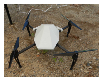
UAV (ドローン) 飛行見学

令和元年8月19日（月）に新発田南高校土木工学科2年生34名が「地域の課題解決」や「地域産業の理解」を目的に授業の一環として、同校卒業生が多く勤務している羽越河川国道事務所の職員と意見交換会を行いました。また、意見交換に先立ち、鷹ノ巣道路の工事現場で実際に使われている最新技術（ICT建設機械）を見学・体験をしました。