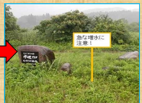
注意喚起看板を設置