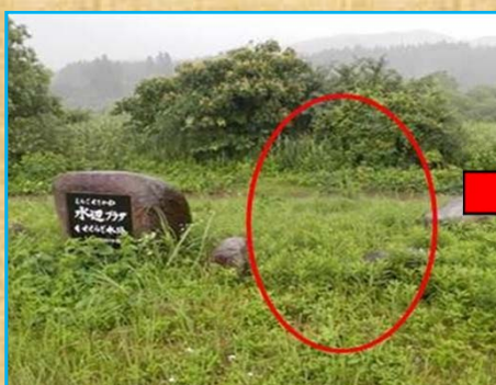
河原への進入路に注意喚起看板がない