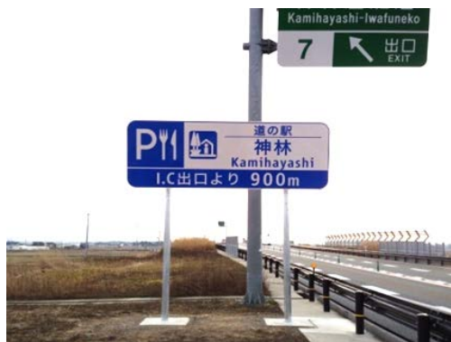
道の駅「神林」を案内した標識

また、村上市の観光拠点である「道の駅」の来訪者が増えることで、地域活性化につながることも期待しています。