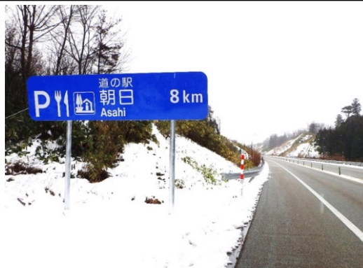
道の駅「朝日」を案内した標識